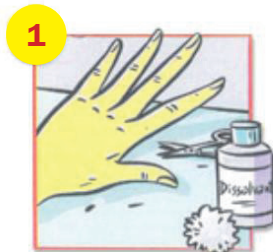
Enlever le vernis

Le matin de l'intervention , vous prendrez une deuxième douche à votre domicile en procédant de la même façon que la veille. Il ne sera pas nécessaire de refaire un shampoing. Revêtez des vêtements propres et n'appliquez aucun cosmétique (crème, déodorant, parfum, maquillage...). N'oubliez pas de vous brosser les dents, même si vous êtes à jeun.