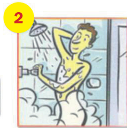
Se mouiller le corps et les cheveux