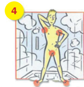
Insistez sur les aisselles, le nombril, les régions génitales et anales puis sur les pieds