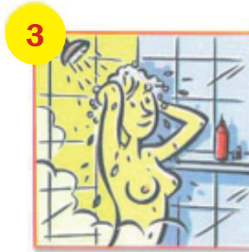
Savonnez vous avec un un savon et un shampoing neuf